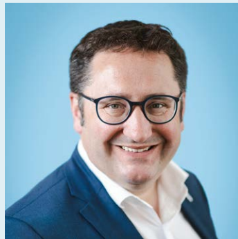
Tobias Gotthardt MdL Staatssekretär im Bayerischen Staatsministerium für Wirtschaft, Landesentwicklung und Energie