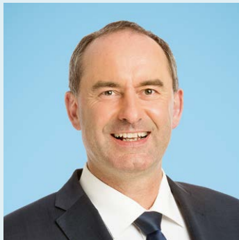
Hubert Aiwanger, MdL Bayerischer Staatsminister für Wirtschaft, Landesentwicklung und Energie