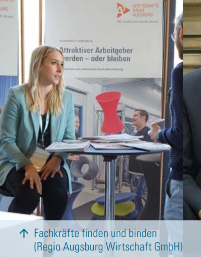
↑ Fachkräfte finden und binden (Regio Augsburg Wirtschaft GmbH)