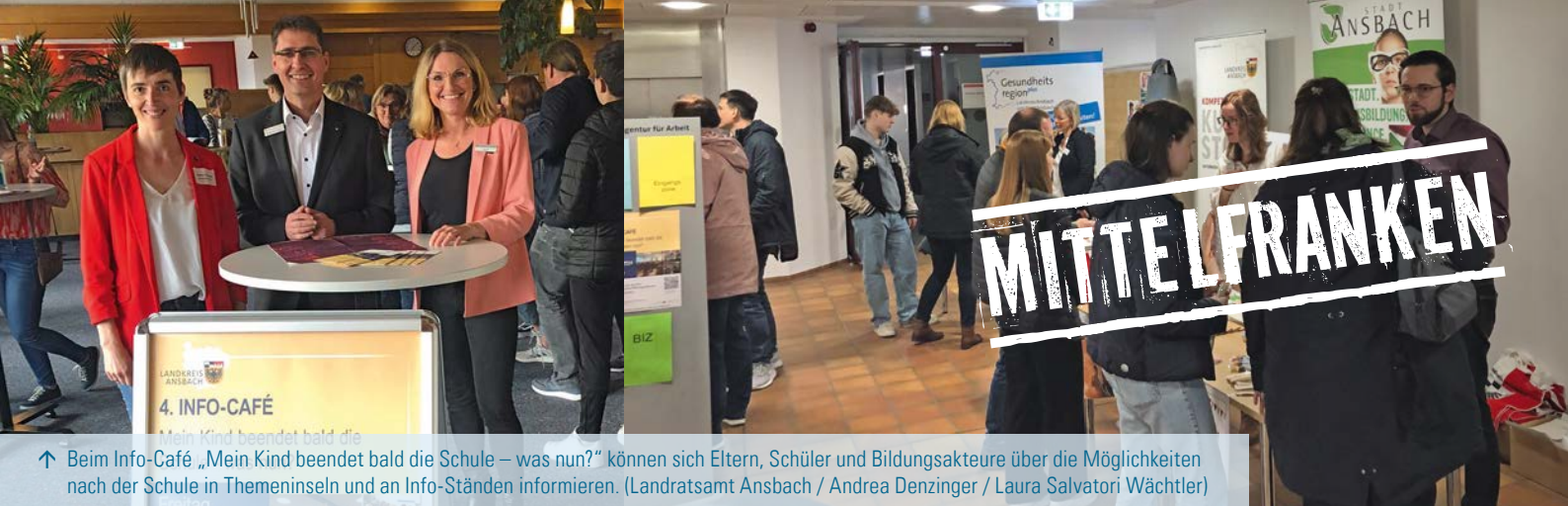
↑ Beim Info-Café „Mein Kind beendet bald die Schule – was nun?“ können sich Eltern, Schüler und Bildungsakteure über die Möglichkeiten nach der Schule in Themeninseln und an Info-Ständen informieren.