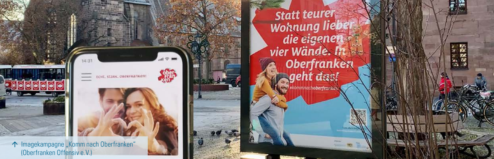
↑ Imagekampagne „Komm nach Oberfranken“ (Oberfranken Offensiv e.V.)