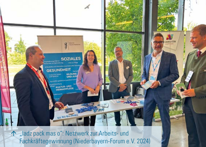
↑ „Iadz pack mas o!": Netzwerk zur Arbeits- und Fachkräftegewinnung (Niederbayern-Forum e.V. 2024)