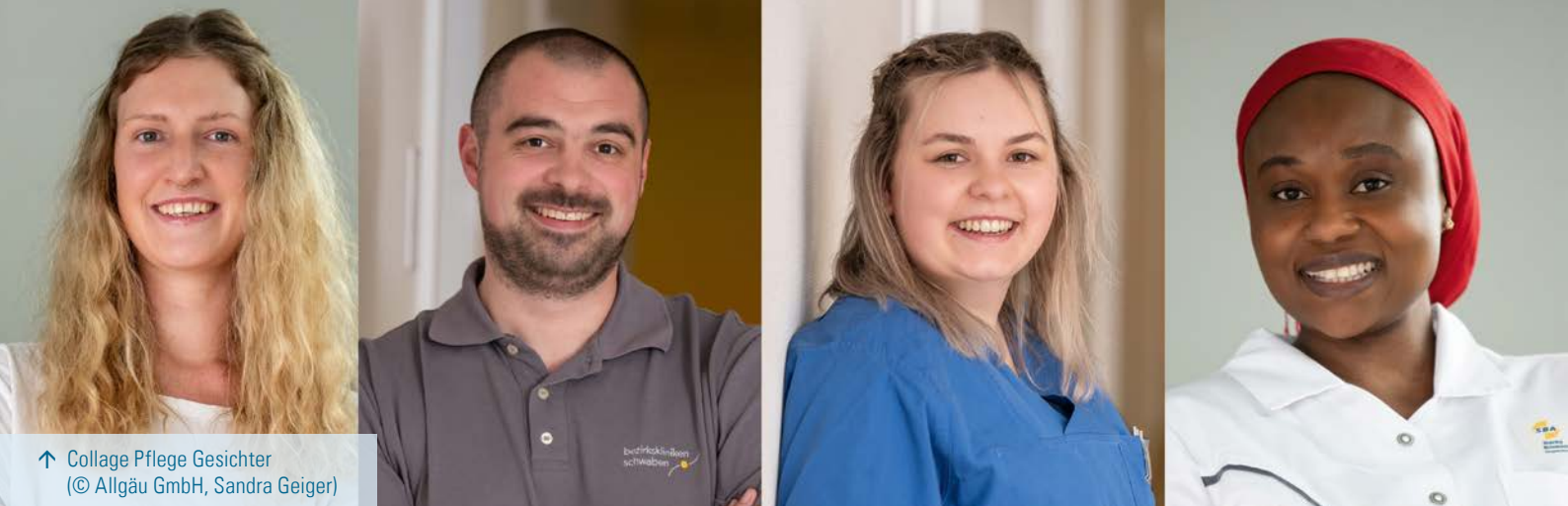
↑ Collage Pflege Gesichter