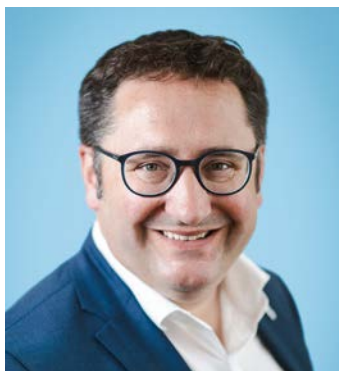
Tobias Gotthardt, MdL

Staatssekretär im Bayerischen Staatsministerium für Wirtschaft, Landesentwicklung und Energie