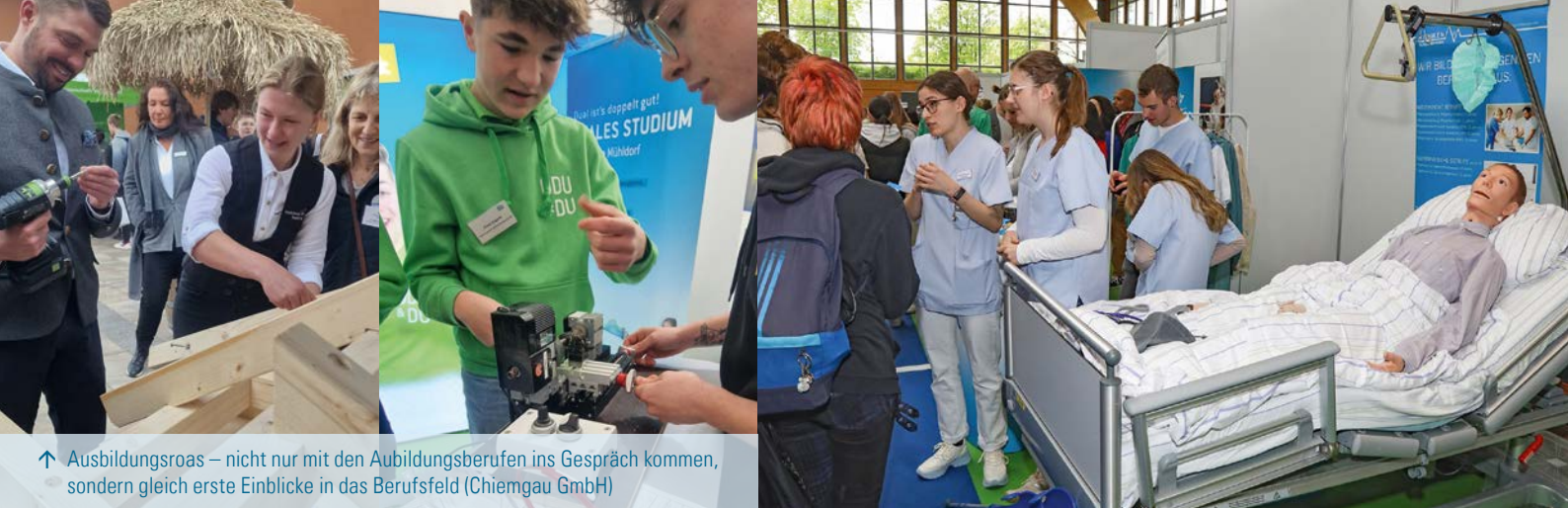
↑ Ausbildungsroas – nicht nur mit den Ausbildungsberufen ins Gespräch kommen, sondern gleich erste Einblicke in das Berufsfeld (Chiemgau GmbH)