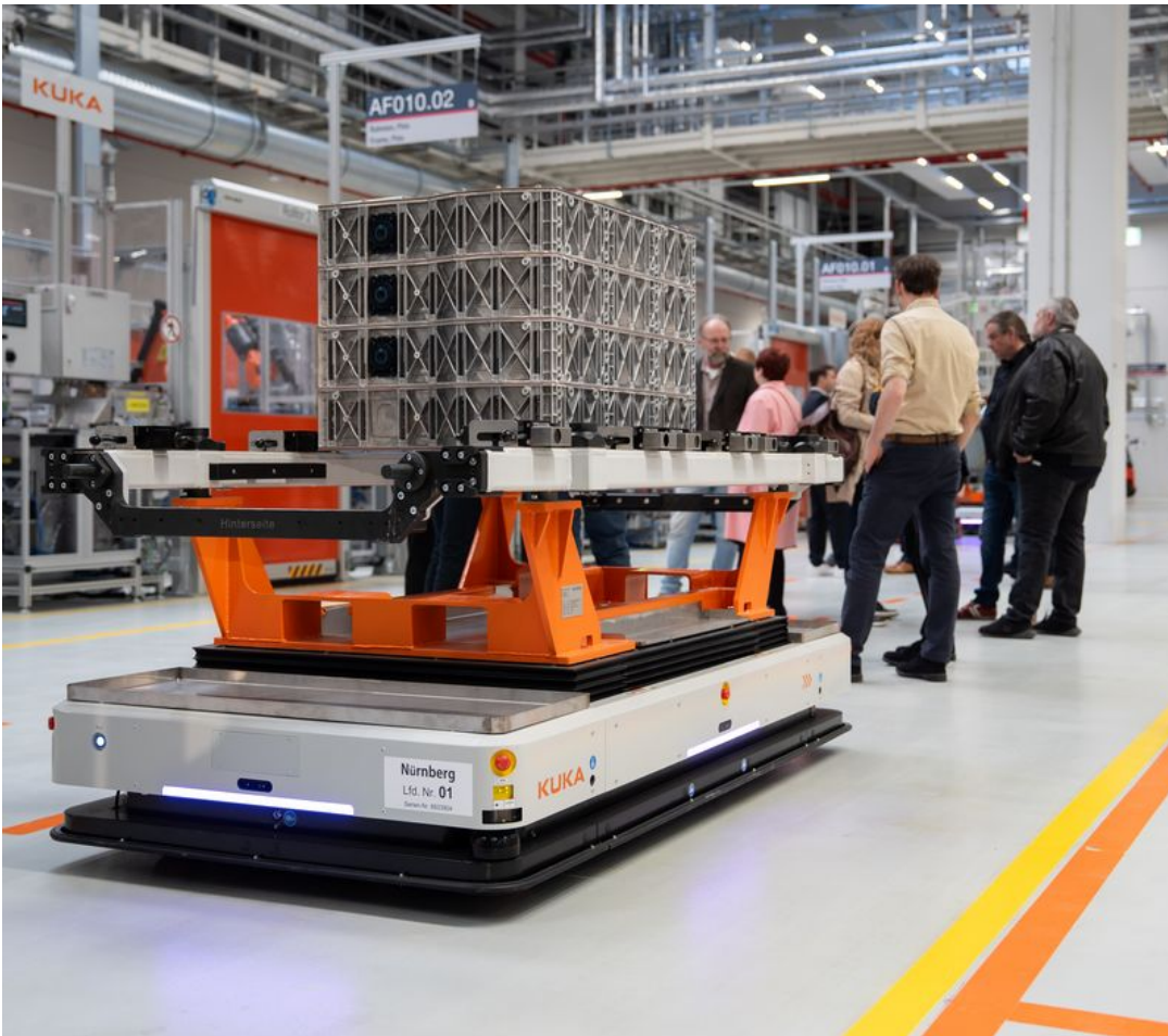
Heute hat Bayerns Wirtschafts- und Energieminister Hubert Aiwanger das neue Batteriewerk der MAN Truck & Bus SE in Nürnberg besucht.