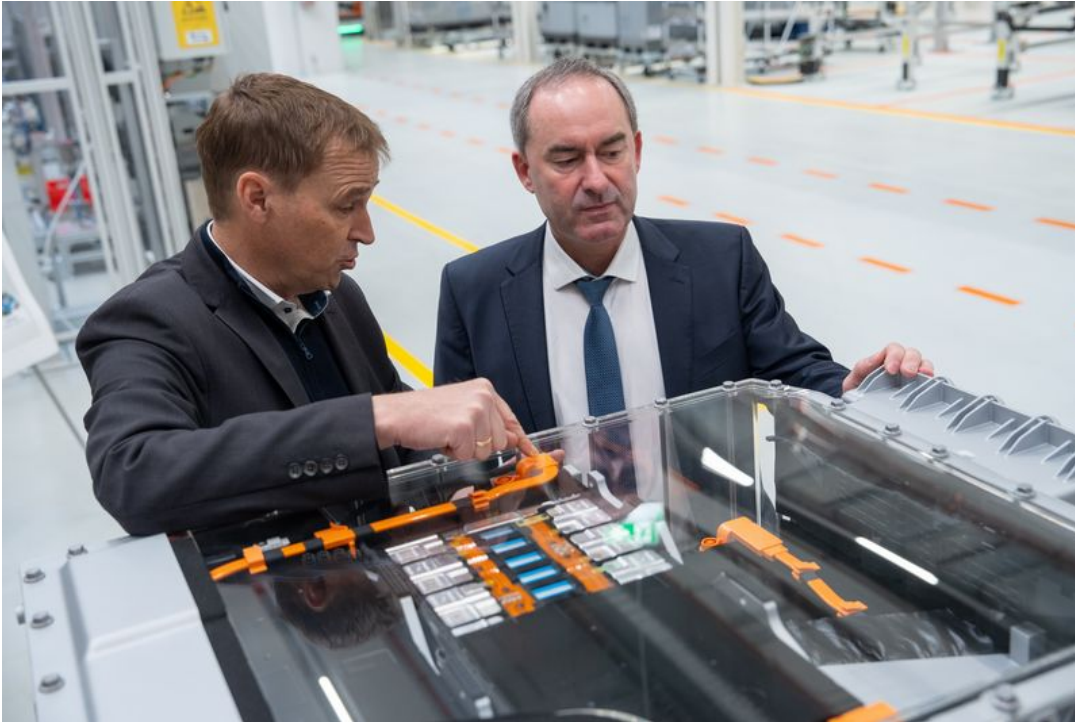
Seit heute werden in Nürnberg Batteriepacks für Nutzfahrzeuge gebaut. Bayerns Wirtschafts- und Energieminister Hubert Aiwanger hat das neue Batteriewerk der MAN Truck & Bus SE in Nürnberg besucht und sich über die dortige Produktion informiert.