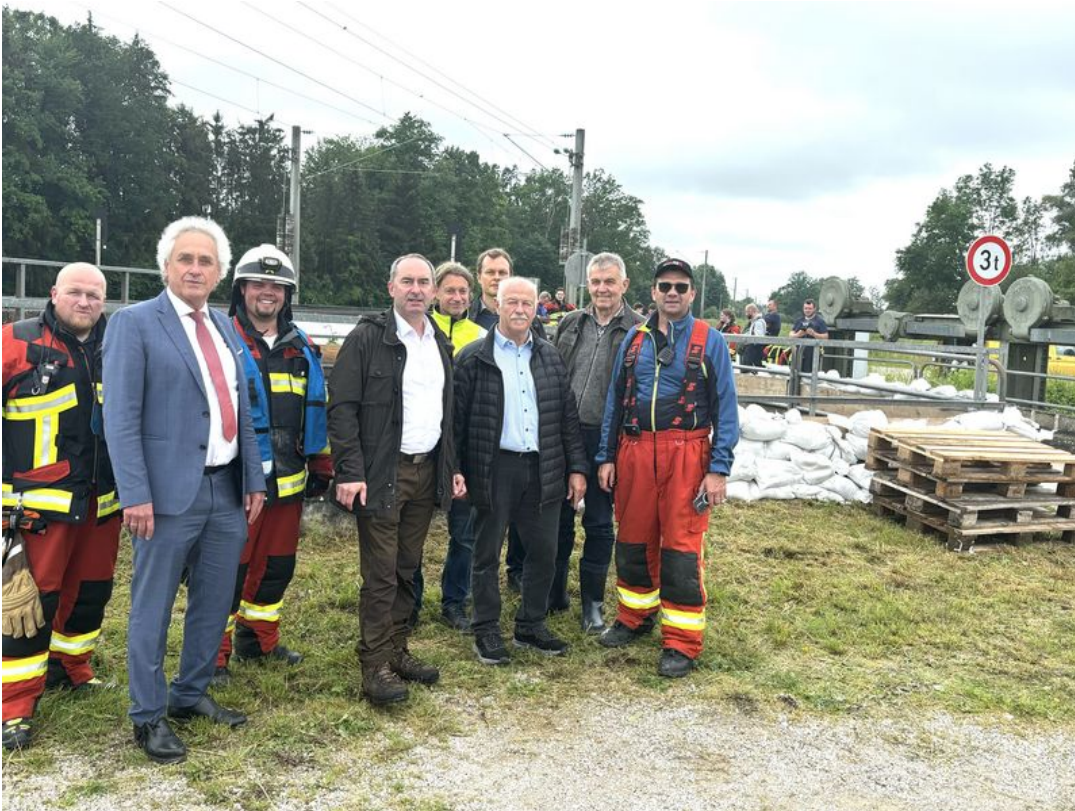
Bayerns Wirtschaftsminister Aiwanger informiert sich in Moosburg über die aktuelle Lage